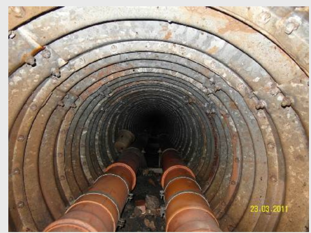
Blick in den Rohrtunnel